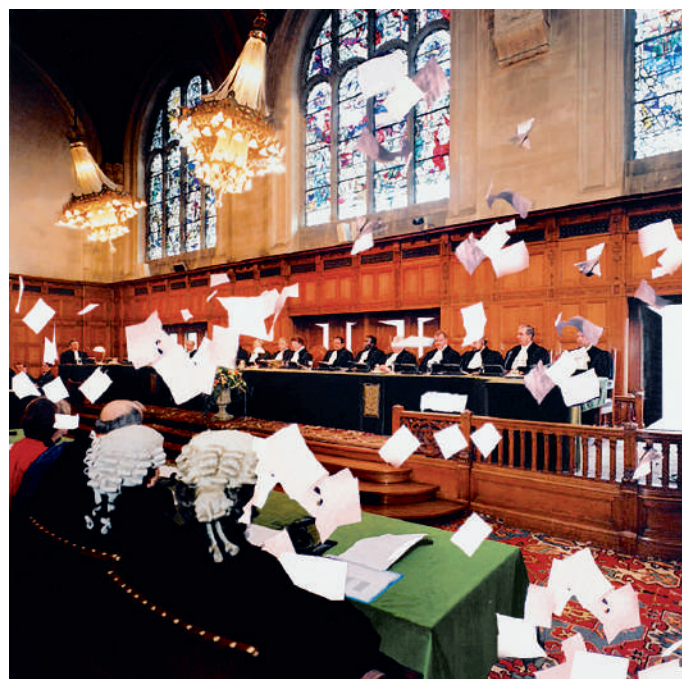
© Susana Gaudêncio Provoking Theater , 2007