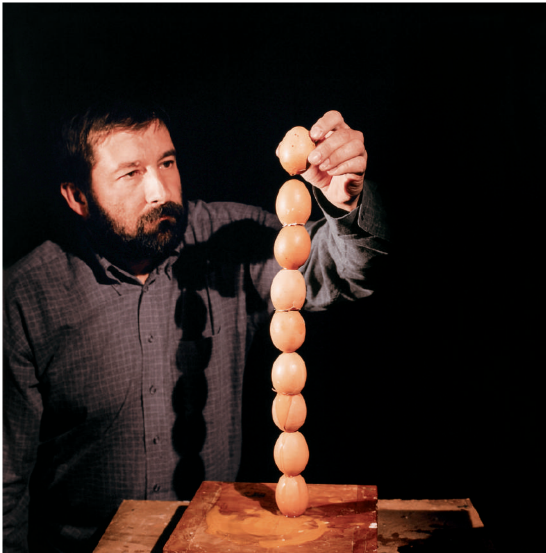
© João Maria Gusmão e Pedro Paiva A Coluna de Colombo , 2006