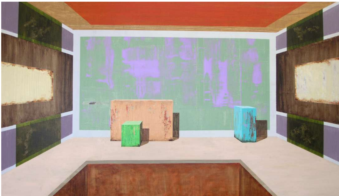
© Carlos Correia Sem título (Devir) , 2016